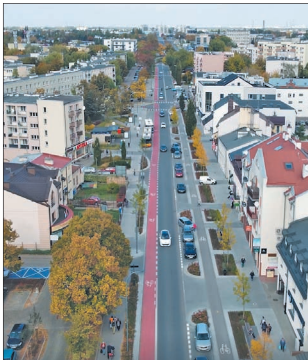
Ulica Puławska w Piasecznie

Wraz z powiatem opracowaliśmy także projekt przebudowy skrzyżowania ulic Okulickiego i Wojska Polskiego, by poprawić bezpieczeństwo i ułatwić pokonanie skrzyżowania dróg krajowej, wojewódzkiej i powiatowej. Liczymy na to, że inwestycję tę zrealizuje w najbliższym czasie MZDW w porozumieniu z Generalną Dyrekcją Dróg Krajowych i Autostrad. Z zarządcą biegnącej przez gminę Piaseczno drogi krajowej nr 79 gmina również współpracowała w ostatniej kadencji – przede wszystkim zgłaszając swoje uwagi i sugestie odnośnie do projektowanej przebudowy DK79 na odcinku od Piaseczna do obwodnicy Góry Kalwarii. Zrealizowaną w latach 2021–2022 przez GDDKiA rozbudowę ul. Puławskiej o trzeci pas ruchu dla każdego kierunku na odcinku między ulicami Syrenki i Energetyczną poprzedziło przygotowanie i sfinansowanie projektu tej inwestycji przez gminę Piaseczno. Kolejnym zarządcą dróg na naszym terenie, z którym współpracujemy, jest Mazowiecki Zarząd Dróg Wojewódzkich. Gmina Piaseczno dofinansowała przygotowanie