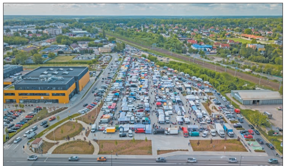
Targowisko miejskie w Piasecznie

Na szkolne i przedszkolne inwestycje gmina Piaseczno wydała w ostatnich pięciu latach łącznie ponad 47 mln zł.