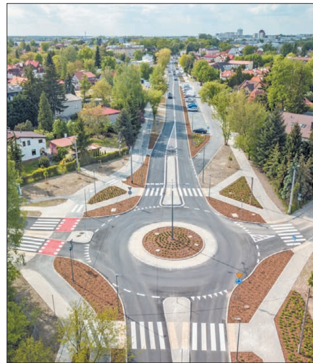
Ulica Księcia Janusza I Starego w Piasecznie