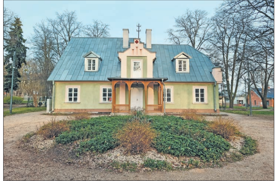
„Poniatówka”, filia Muzeum Piaseczna

Oczywiście w mijającej kadencji realizowane były także inwestycje oświatowe. W 2019 roku zakończyła się budowa najnowocześniejszego jak dotąd obiektu w naszej gminie – Centrum Edukacyjno-Multimedialnego, w którym działają Szkoła Podstawowa nr 4 oraz Biblioteka Publiczna w Piasecznie. Szkoła Podstawowa im. Tade-