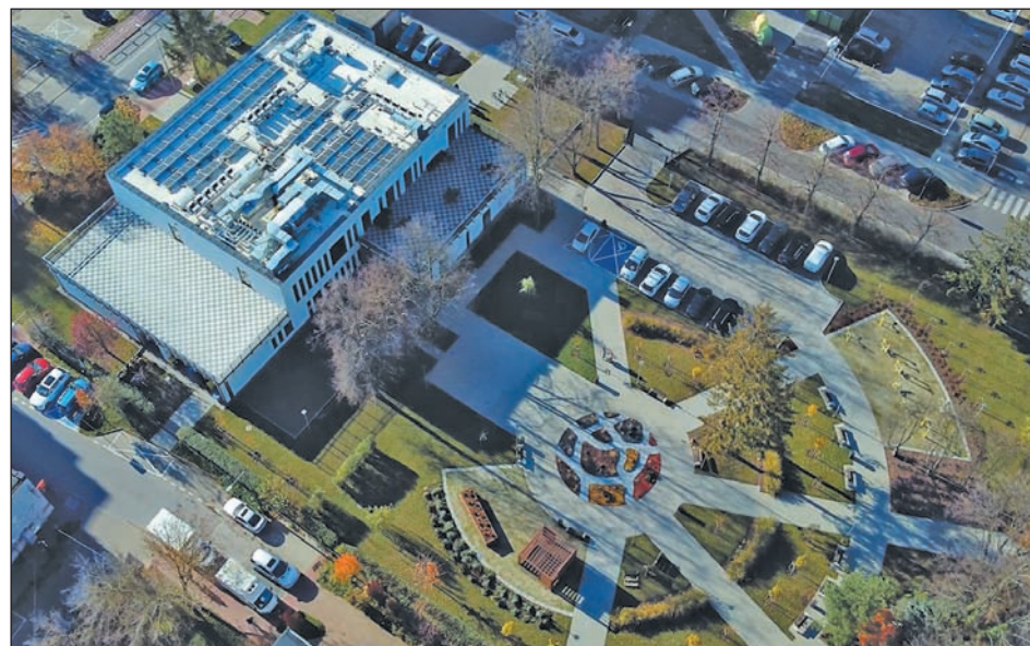
Przystań Pod Klonami – Centrum Aktywności Seniora w Piasecznie