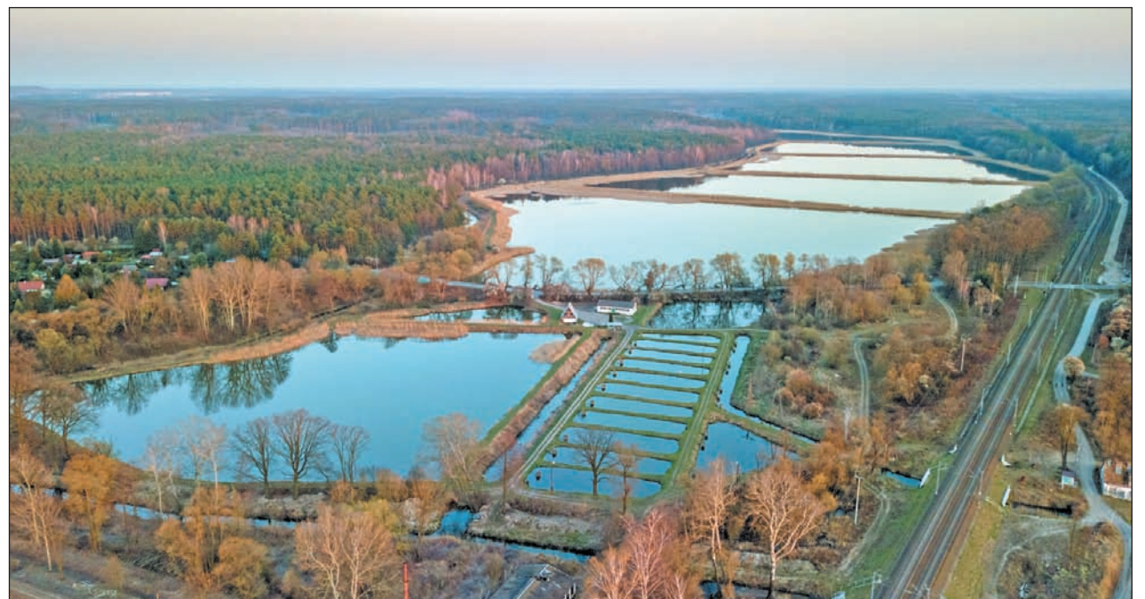
Stawy hodowlane w Żabieńcu / Lasy Chojnowskie

Tereny zielone wpływają pozytywnie nie tylko na jakość powietrza, lecz również na komfort życia mieszkańców. A dodatkowo pełnią istotną rolę w gospodarowaniu wodami opadowymi. W tej kadencji przygotowane zostało opracowanie, w którym analizie poddany został cały system odwodnieniowy istniejący na terenie naszej gminy. W oparciu o nie stworzono model, który jest punktem wyjścia do realizacji programu ochrony przeciwpowodziowej. Realizacja tego programu wymaga oczywiście sporych nakładów finansowych oraz gotowości do współpracy Wód Polskich, zarządców innych elementów sieci odwodnieniowej, w tym sąsiednich gmin, prywatnych inwestorów czy samych mieszkańców – ale pierwsze działania w tym zakresie już zostały podjęte. Uzupełnieniem działań związanych z tworzeniem efektywnego gospodarowania wodami opadowymi jest system kanalizacji deszczowej i zbiorników retencyjnych, budowany wraz z infrastrukturą drogową. Wszędzie tam, gdzie to możliwe, staramy się tworzyć retencję wody za pomocą błękitno-zielonej infrastruktury. Są to otwarte rowy i tereny przeznaczone pod zalanie wodą, pokryte odpowiednimi nasadzeniami, jak np. tereny przylegające do Kanału Piaseczyńskiego.